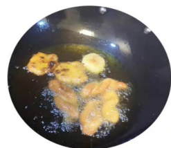
我在这里 Pitu Photo